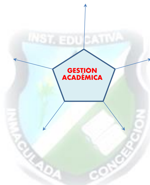
Componentes de la Gestión Académica

Esquemáticamente, los procesos de la Gestión Académica o de Aula se resumen en la siguiente figura.