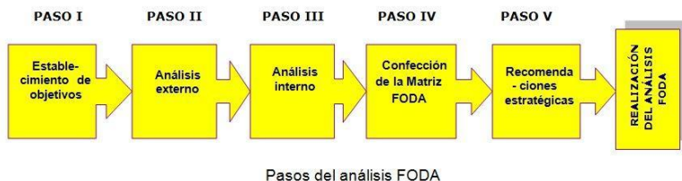
FIGURA N° 2. Estructura Metodológica del Análisis Situacional.

El análisis situacional queda expresado en la Autoevaluación del año 2017.